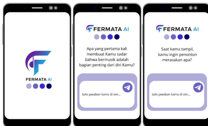
Gambar 1. Screenshot tampilan sistem FERMATA AI saat sesi refleksi fase awal

juga diungkapkan oleh alumni, yang merasa bahwa sistem ini berhasil menstrukturkan proses yang sebelumnya hanya terjadi secara acak dan tak terdokumentasi.